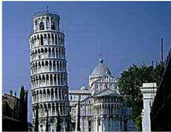
Aus: Infopedia 3.0 © 1998 The Learning Company, Inc.